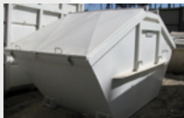
Contenedor cerrado de 10m 3