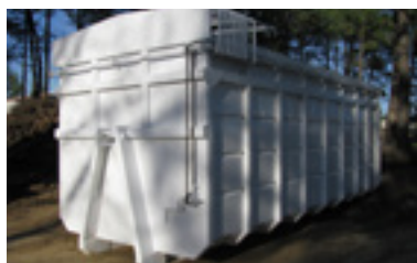
Contenedor de 30m 3