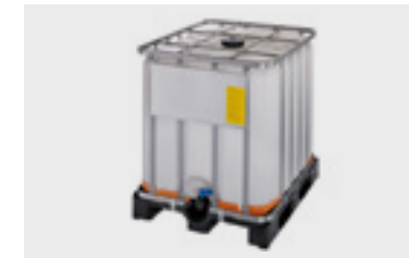
Cuba cerrada 1 m 3