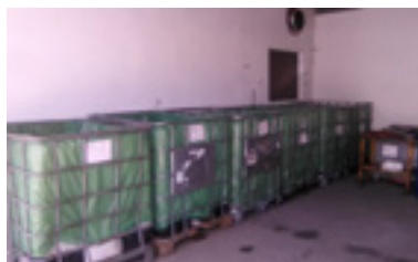
Cuba abierta 1m 3