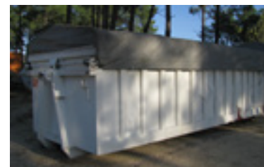
Contenedor de 20m 3