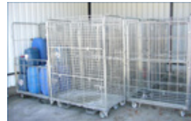
Cajas de 1,5m 3