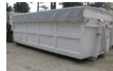
Contenedor de 25m 3