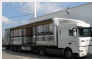
Interior con toldo