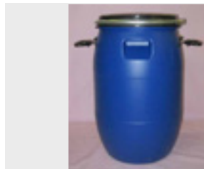
Barril de 30/60 L