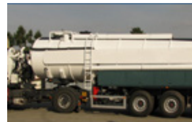
Hidroaspirador de 8 a 25m 3